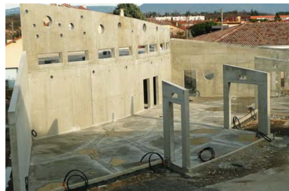
L'état actuel de la construction