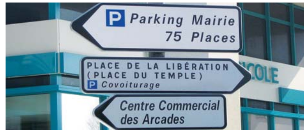
Le panneau est déjà installé pour le parking du Temple, l'un des deux lieux de covoiturage avec l'Espace Cristal.