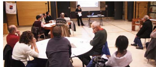
150 personnes ont participé aux divers ateliers de l'Agenda 21

Renseignements : ADIL 26, 44 rue Faventines 04 75 79 04 13 - site : www.pie.dromenet.org En mairie : service développement durable : 04 75 57 74 74, service urbanisme : 04 75 57 95 21 mail : jvye@ville-portes-les-valence.fr