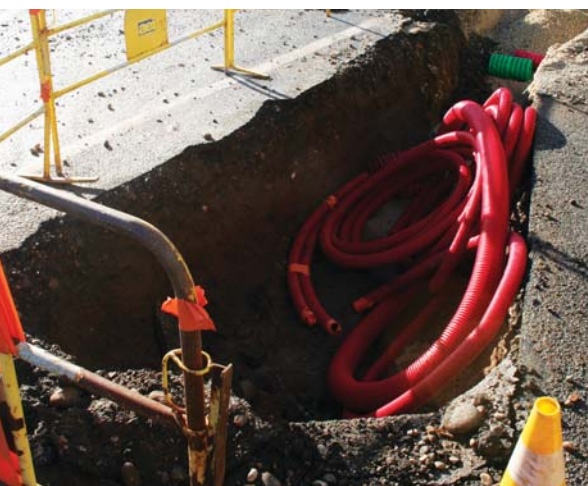
L'enfouissement des réseaux

La rue Paul Vaillant-Couturier s'étire le long des voies de la gare de triage dans le quartier Ouest. Son mauvais état nécessitait sa réfection. En janvier, les réseaux d'éclairage public ont