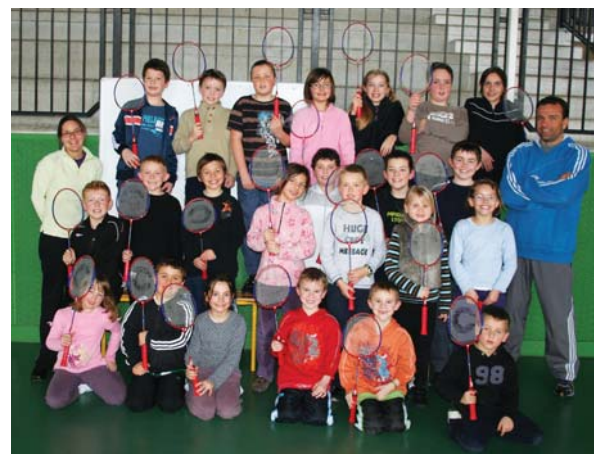
Avant une séance de badminton