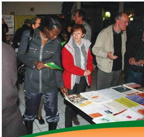
Animation lors du Forum 21

Les entreprises présentes lors de cet atelier sont : KDI-Merlin, FDGDON, Entreprise 26, Valence véhicule industriel, Iggesund, Rangeval cuisines, Entreprise Prevot, ELCA (armée de l'air), Transports Gondrand, CAPEB 26, Megnant, Rhône-Alpes Energie Environnement, Gest Eco.