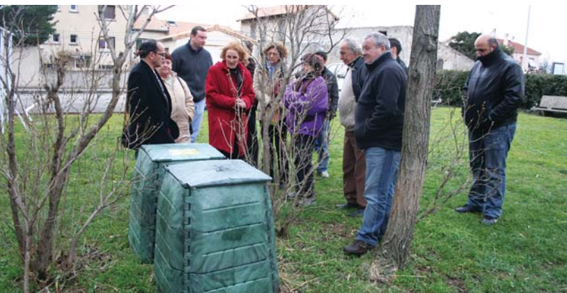
Visite sur le terrain avec les deux composteurs

Bilan positif de l'expérience à la Cité Ouest