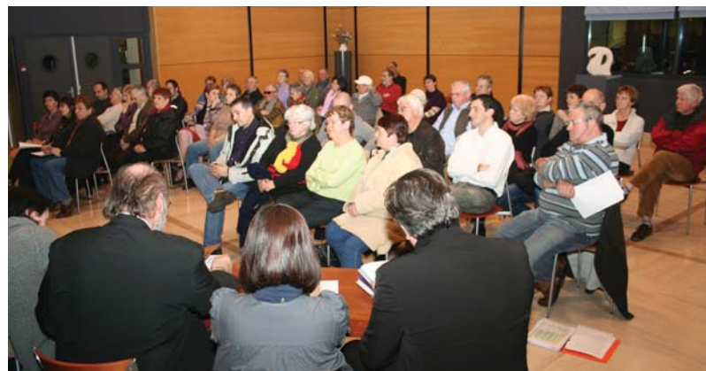
Les Portois, soucieux des finances locales

D'autre part, dans un contexte national de crise économique, financière, sociale et écologique, le désengagement de l'Etat se poursuit, notamment avec une Dotation Globale de Fonctionnement, dont la progression + 0,6 % sera inférieure à l'inflation (+ 1,2 %). À cela s'ajoute l'augmentation supérieure à l'inflation, du coût du panier du maire, ce dernier étant un indice national mesurant le niveau des dépenses communales, comme les achats,