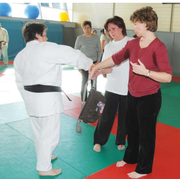
Une def de jujitsu

Il y a cent ans, à Copenhague, à la deuxième conférence des femmes socialistes, l'idée d'une "Journée internationale des femmes" est adoptée sur proposition de Clara Zetkin, représentante du puissant parti socialiste d'Allemagne. Cette journée sera une journée de manifestations dans le monde entier et deviendra l'emblème du combat des femmes pour leurs droits.