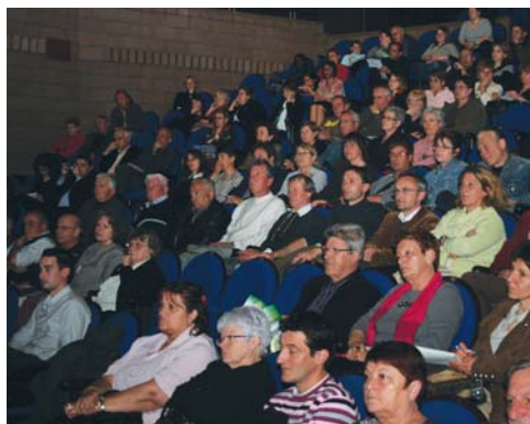
Lors du Forum 21, le mardi 7 avril 2009 au Train-Théâtre