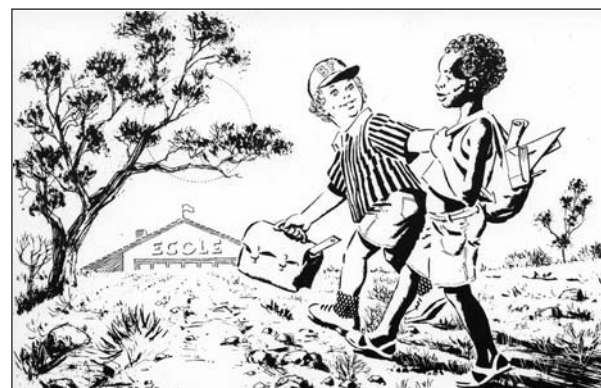
Carte postale réalisée par José de Huescar pour “Coup de pouce 26-07”

On y verra donc les œuvres d’un véritable artiste et son environnement de travail, grâce au chevalet qu’il avait en partie construit lui-même. Un retour à Portes pour José de Huescar. En 1993, en effet, il avait, bénévolement, dessiné la carte postale de l’association “Coup de pouce 26-07”, dans laquelle la municipalité