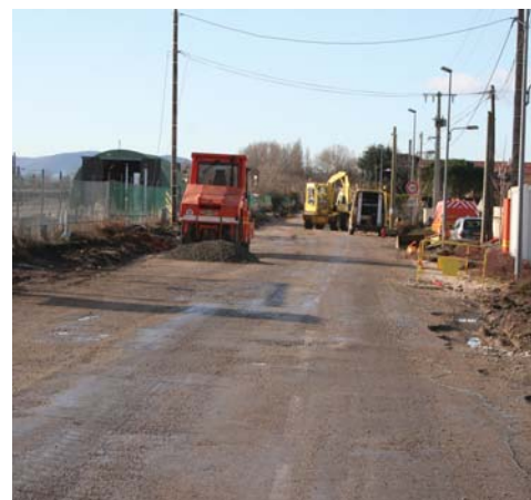
Rue Paul Vaillant-Couturier

Il sera donc fin prêt pour accueillir ses premiers convives pour la rentrée des classes de septembre.